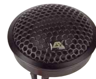
Der Hochtöner im Metallgehäuse ist ein echtes Sahneteil mit ausgedehntem Frequenzgang

Das QXE6.2Cv2 gehört zu den wenigen Systemen, die unseren Messparcours ohne Fehl und Tadel durchlaufen. Hier stimmt wirklich alles, angefangen bei der sehr großzügigen Parametrie des Tieftöners mit jeder Menge Antrieb und Wirkungsgrad. Auch der Amplitudenfrequenzgang zeigt sich von der besten